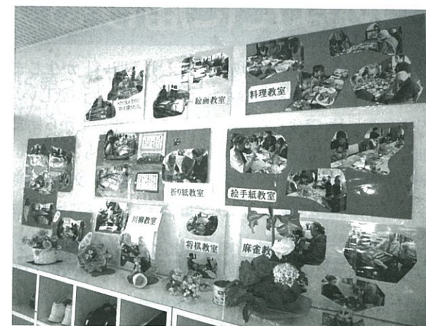
「福ろう」入口に掲示してある多彩なメニュー

「我が事・丸ごと」として「福ろう」を運営していく中で、認知症をお持ちの方のご利用や認知症に関する相談が多く出てきました。できるだけ長く住み慣れた場所で生活が続けられるために我々にできることは何かを考え、2016(平成28)年より認知症カフェ「ふくろう茶屋」を毎月1回開催するようになりました。そこでは、認知症の方と家族が集うだけでなく、みのり村の就労事業を利用するご利用者が運営の補助や販売・接客に入り、交流もしています。「私たちが明るく接して、皆で元気になればいい」と話してくるご利用者は、今では認知症カフェになくはない存在となっています。障がいのあるご利用者、高齢者、認知症の方、地域の方々、まさに“誰もが、いつでも、気軽に”集う場所になっています。近々、