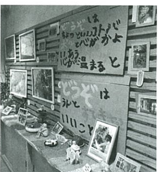
ご利用者の作品が飾られている店内 (m・歩っ)

2001(平成13)年、その花畑の一角にみのり村の生産品を販売する販売所「縁」を建築しました。「縁」は地域の方に気軽に立ち寄っていただき、法人やご利用者の活動を知っていただく場であり、ご利用者の就労にも繋がりたいという思いの下、3坪ほどの建物を建てて始めました。みのり村で生産した野菜や果物、花卉、味噌やパンなどの販売を通して、地域の方へも少しずつ認識されてきました。販売を担当するご利用者にとっても、お客様から名前を覚えていただける、「また買いに来るね」という言葉をいただけることで自信にも繋がっていき、働くことの喜びを