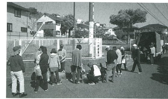
移動販売「十日市」の様子

当初は認知度が低く、準備していた生産品が多く残ることもありました。しかし、雨の日や風の強い日でも休むことなく開催し、お客様から花の植え方がわからないと聞けばご自宅に伺って植え方をお伝えするなど、地道な取り組みを続けていきました。結果、特にパン・野菜はすぐに売れ、家庭に飾れる花や野菜苗、そしてそれを育てるための有機堆肥もよく売れるようになりました。毎月10日に開催していたことから数年後には「十日市」と呼ばれ始め、自治会も販売日の前に回覧板で開催を知らせてくれたおかげで次第に周知されていきました。今では移動販売車が到着する前から住民の方が集まっており、待っている間も世間話や今日買う物についての話題など、笑顔と笑い声が聞こえてきます。販売に携わるとご利用者の中には、住民の方に顔と名前を覚えていただいている方もいます。「大切に育てた品物をお客さんが買ってくれるのがうれしい」と話し、住民の方からの「ま